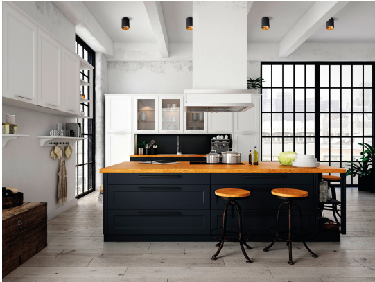
KANLUX S.A. (kat 27571) RITI GU10 B/G + TOMI LED5W / LDC (Polar)

Luminaire: KANLUX S.A. (kat 27571) RITI GU10 B/G + TOMI LED5W Lamps: 1 x TOMI LED5W GU10-WW