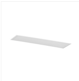
BRAVO S 40W12030NW W